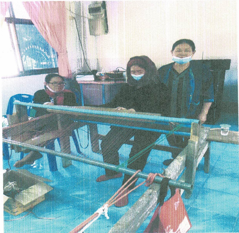
โครงการส่งเสริมสังคมน่ายู่และพัฒนาคุณภาพชีวิตทุกช่วงวัย การทอเสื่อจากต้นกก (ร่วมกับสนง.จัดหางานจังหวัดศรีสะเกษ)