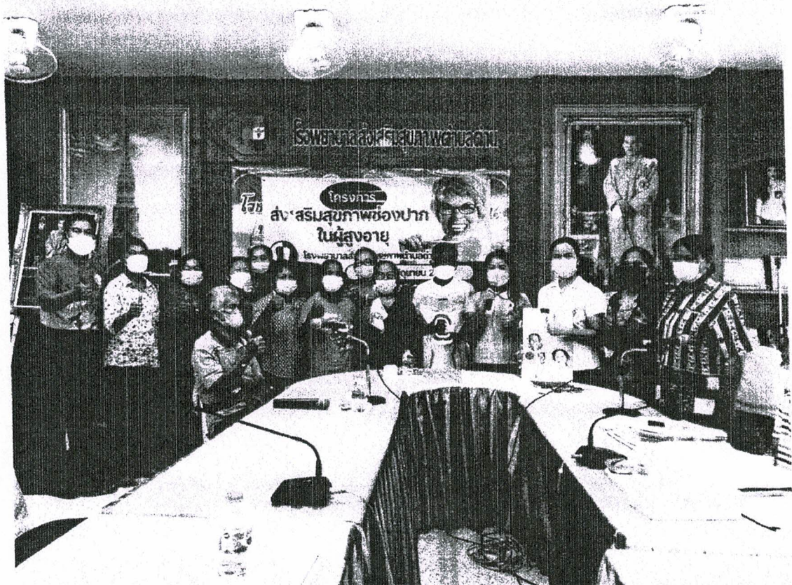
ภาพกิจกรรมการประชุมโครงการส่งเสริมสุขภาพช่องปากในผู้สูงอายุ วันที่ 16 มิถุนายน 2565 ณ โรงพยาบาลส่งเสริมสุขภาพตำบลด่าน